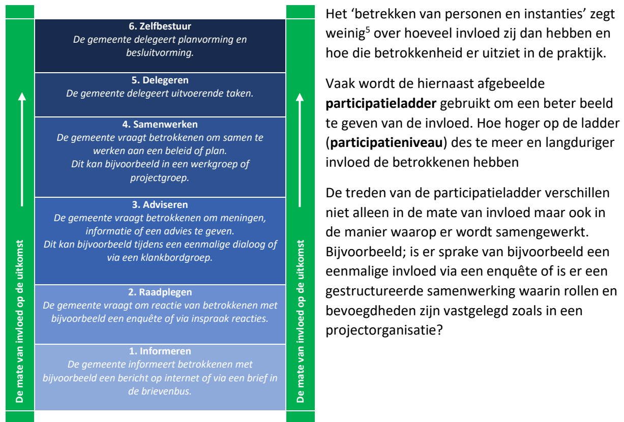
Afbeelding 1 de participatieniveaus op de participatieladder

In onze representatieve democratie is het de gekozen volksvertegenwoordiging die de beslissingen neemt als bevoegd gezag 6 . Vanuit die bevoegdheid kunnen zij ook beslissen de samenleving te betrekken en dus invloed te geven op de besluitvorming. In tabel 1 is te zien hoe een besluit over het participatieniveau bepaalt hoe de invloed en samenwerking eruitzien.